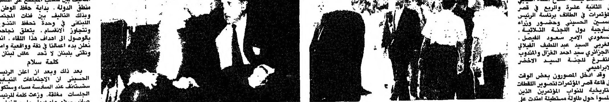
الملك فهد في استقباله (اليمين)

الطائف - من بعة الانوار: انعقدت جلسة افتتاح اللقاء اللبناني المؤتمرات في الطائف برئاسة الرئيس حسين الحسيني وحضور وزراء خارجية دول اللجنة الثلاثية السعودي الأمير سعود الفيصل المغربي السيد عبد اللطيف الفيلالي الجزائري سيد احمد الخزال والمنوب المتضرع للجنة السيد الاخضر الابراهيمي